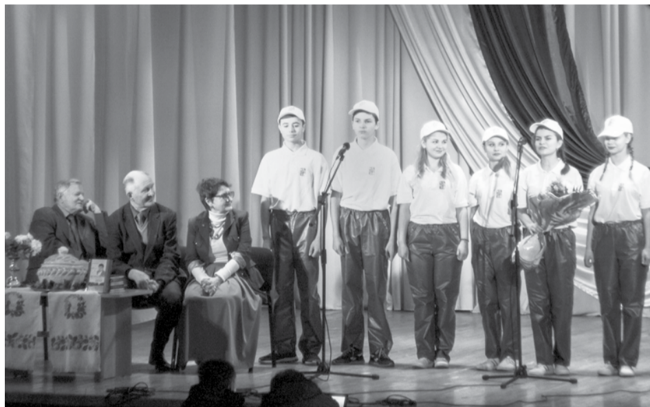
Виступ екологічної бригади «Джерело»

Узагалі поезія цього дня звучала з уст багатьох талановитих людей. Так, учасником заходу було цікаво дізнатися, що вірші про С.С. Антонця також написала його землячка, яка ходила з ним